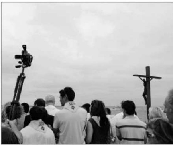
Bénédictin des bateaux aujourd'hui à Andernos.